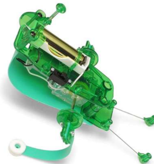
タミヤ フィンキックメカ工作セット