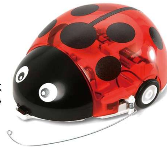
タミヤ 壁つたいメカ工作セット(てんとう虫)

申込 10月13日(木)から先着順。 電話(0258-62-3759)または 直接図書館カウンターまでお申し込みください。参加費無料。