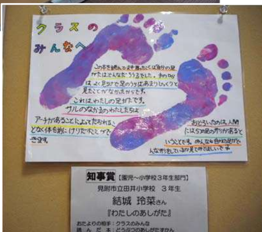
県知事賞受賞作品