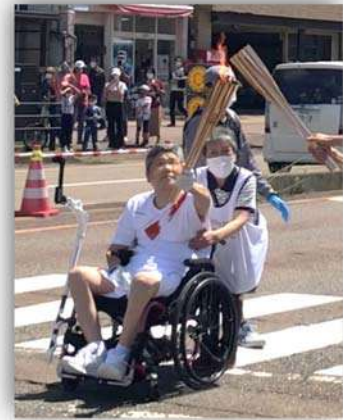
聖火を引き継ぐ波瀲さん