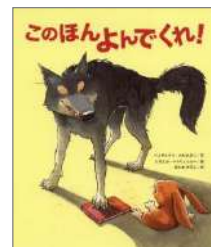
『字のないはがき』 西 加奈子/絵 小学館 『このほんよんでくれ！』 ミカエル・ドゥリュリュール/絵 クレヨンハウス