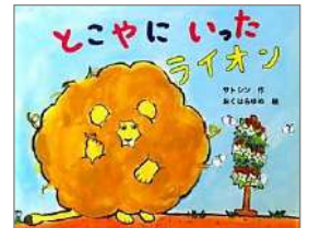
『オレ、カエルやめるや』 マイク・ホルト/え マイクロマガジン社 『とこやにいったライオン』 おくはら ゆめ/絵 教育画劇