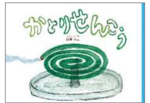
『やさいのおしゃべり』 いもと ようこ/絵 金の星社 『かとりせんこう』 田島 征三/作 福音館書店