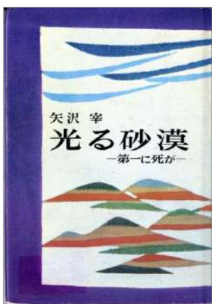
「光る砂漠」南北社 1968年刊