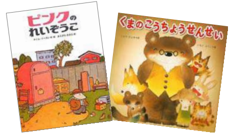
『くまのこうちようせんせい』 こんの ひとみ/作、いもと ようこ/絵 金の星社 『ピンクのれいぞうこ』 ティム・イーガン/作・絵 ひさかたチャイルド