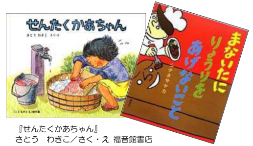
『せんたくかあちゃん』 さとう わきこ/さく・え 福音館書店 『まないたにりょうりをあげないこと』 シゲタ サヤカ/作・絵 講談社