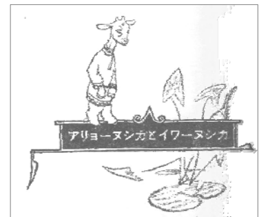
「アリョーヌシカとイワーヌシカ」 『まほうの馬』 岩波書店