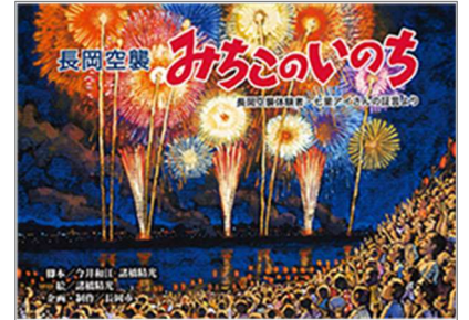
『長岡空襲 みちこのいのち』今井和江・諸橋精光 脚本 諸橋精光 絵 長岡市 企画・制作