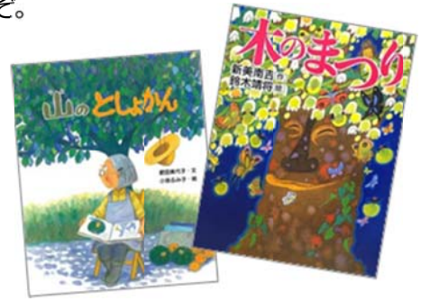
『山のとしょかん』 肥田 美代子/文、小泉 るみ子/絵 文研出版 『木のまつり』 新美 南吉/作、鈴木 靖将/絵 新樹社