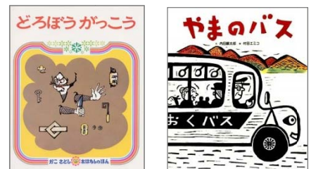
『どろぼうがっこう』 加古 里子/絵と文 偕成社 『やまのバス』 内田 麟太郎/文、村田 エミコ/画 佼成出版社