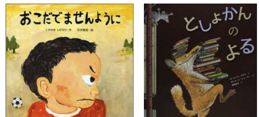
『おこだでませんように』 くすのき しげのり/作、石井 聖岳/絵 小学館 『としょかんのよる』 カトリーン・シェラー/絵 ほるぷ出版