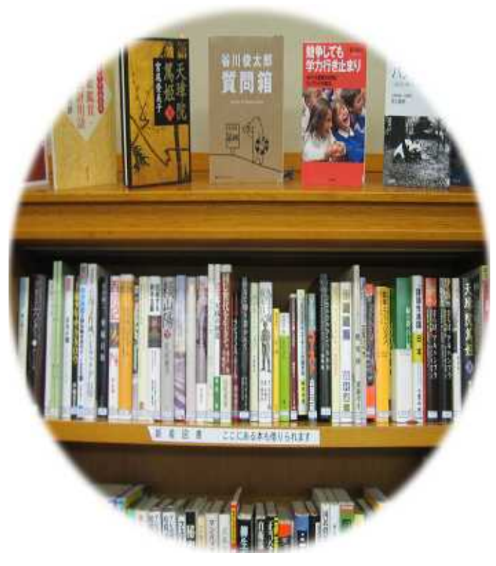
新着図書コーナー