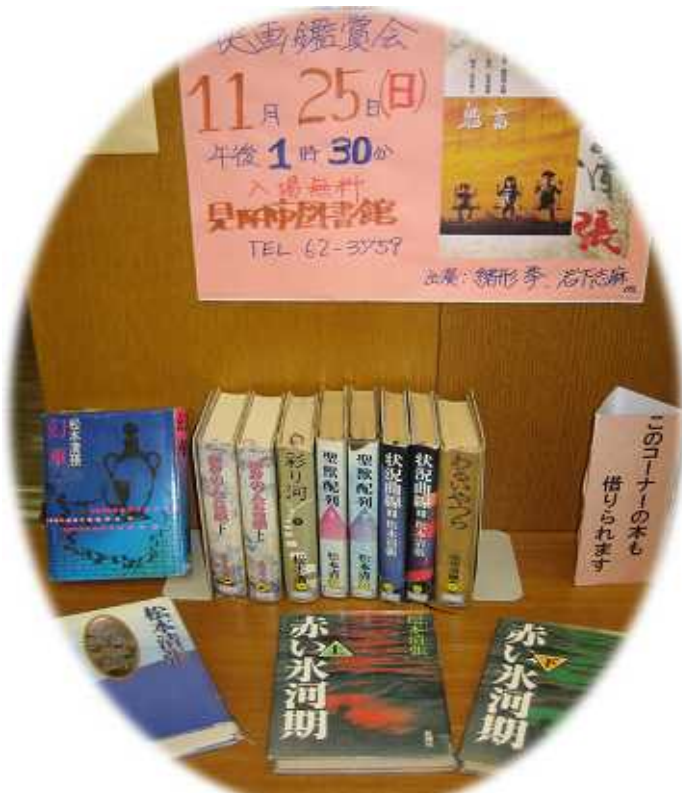
映画鑑賞会関連図書コーナー