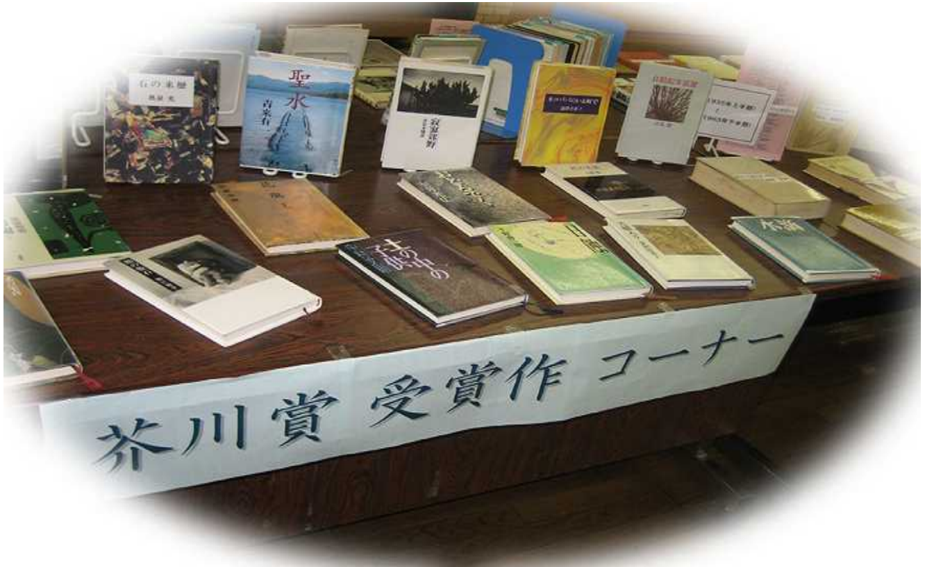
テーマ図書展示～芥川賞受賞作～