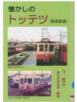
「懐かしのトツテツ」 多川 昌敏 著 あさひ印刷所

大正4年(1915)浦瀬~栃尾の開通から昭和50年(1975)全線廃止までの61年間の栃尾鉄道の記録を写真とともに綴る「懐かしのトツテツ」の出版を記念して、特別展示を行っています。駅や電車の写真のほか、当時の切符なども展示しています。トツテツが懐かしい方、知らない方も十分に楽しめます。また鉄道関連の図書を集めた特設コーナーも併設しています。時刻表が1000号を迎えたこの機会にぜひ、ご覧ください。