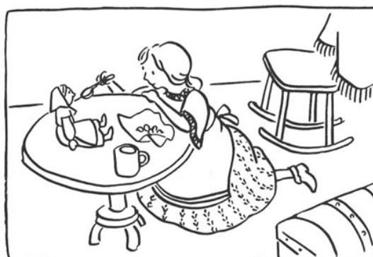
「美しいワシリーサとババ・ヤガー」おはなしのろうそく 4 (東京子ども図書館)